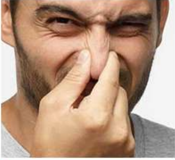
الأطعمة ذات الرائحة الكريهة