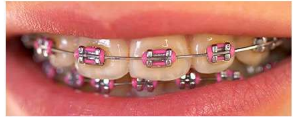
تراكم البكتيريا بسبب إهمال نظافة الفم والأسنان خاصة بعض مرضى التقويم