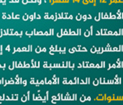
تأخر نمو الأسنان