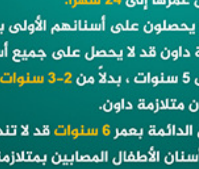
الأسنان والجذور صغيرة